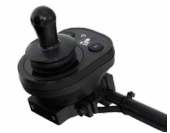
2231 / 2232